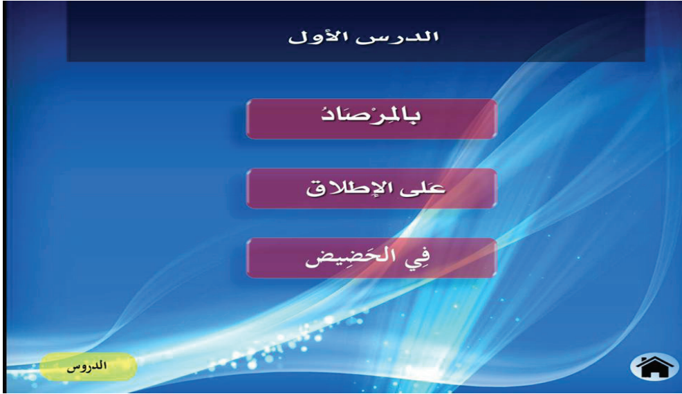
الصورة (2) شريحة الدرس